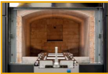
Automatische Invoer Machine

De energiekosten van een DFW Electric zijn bij meer dan 2 crematies per dag, lager dan die van een gas- of olie gestookte crematieoven. Tijdens de crematie wordt de aanwezige energie in het lichaam en de kist efficiënt benut wat resulteert in lage energiekosten. Via de zeer betrouwbare continu meting van O 2 , temperaturen en onderdruk, wordt een constant crematieproces verkregen. Doordat de oven altijd op temperatuur blijft wordt de levensduur van het vuurvaste metselwerk verlengd. De onderhoudskosten worden hierdoor op een zeer laag niveau gehouden. De hoge kwaliteit, de lage investering en de goede prestaties op het gebied van ergonomie en elektriciteitsverbruik maken de DFW Electric tot de juiste 'groene' keuze.